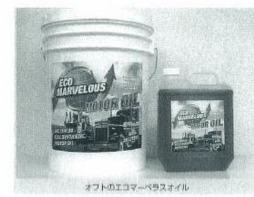
オフトのエコマーベラスオイル

ないで、燃焼効率が向上し燃費も向上する。同社によると、実績では、5・8・16・5%の燃費の向上が確認されているという。使用条件によらず、また万一のトラブルが発生した場合でも、PL保険によって保証される（現在まで1件の適用もなし）。